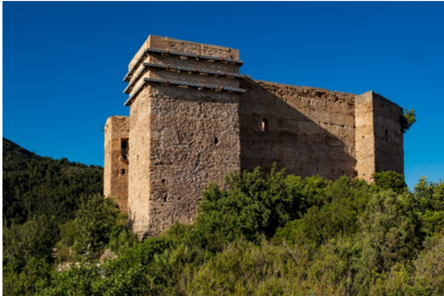
Vista del Castell de Fornà

Després des del castell podeu baixar fins a Fornà on podeu visitar el llavador i la font subterrània. Recomanem dinar allí abans de tornar cap a l'Atzúbia. Per a tornar i finalitzar la jornada podeu fer el mateix camí o seguir la ruta del Carritxar fins a l'Atzúbia. A través d'aquesta podrem gaudir d'una meravellosa panoràmica del Parc Natural de la Marjal Pego-Oliva, del vessant est de la serra de Mostalla i Segària i fins i tot podrem visualitzar de lluny el Montgó.