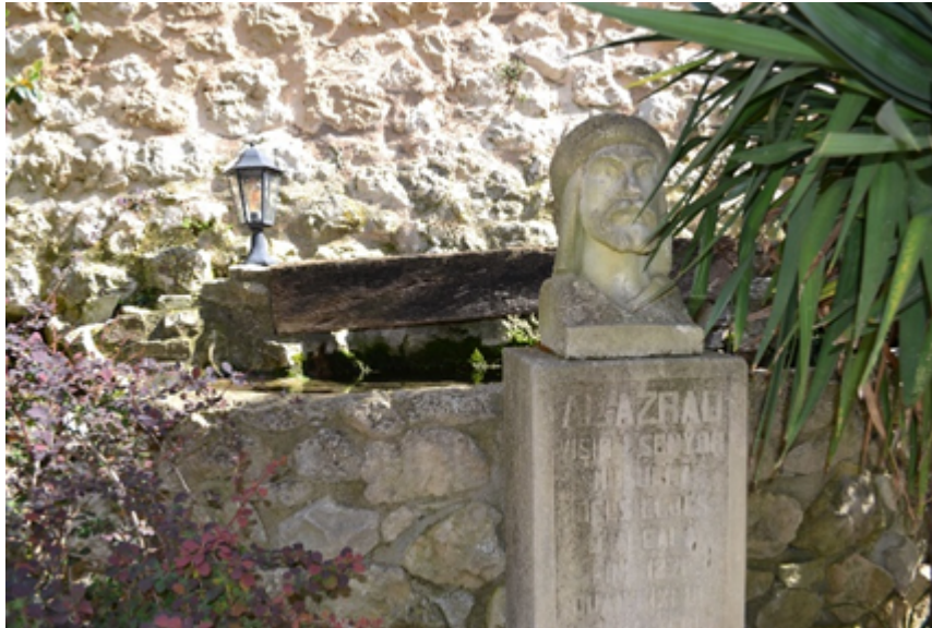
Font de l'església