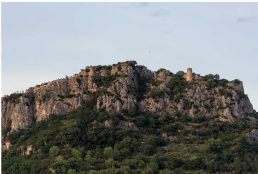
Vista del castell de Benirrama

La funció històrica del castell era la de vigilar i defensar l'entrada a la vall des de la mar. El primer document on apareix del castell de Ghallinayra data de 1245, en el Pacte del Pouet. En 1247, durant el primer alçament, els sarraïns van prendre aquest castell. L'1 de juny de 1258, el castell va ser recuperat pel rei Jaume I qui, a partir de 1261, el va cedir diversos personatges per a cobrir els deutes que tenia amb ells. El 22 de juny de 1322, Jaume II va donar el castell al seu quart fill, l'infant Pere d'Aragó, comte de Ribagorça. Aquesta donació va posar fi a la situació de reialenc per al districte de Gallinera, que passà a ser un senyoriu feudal.