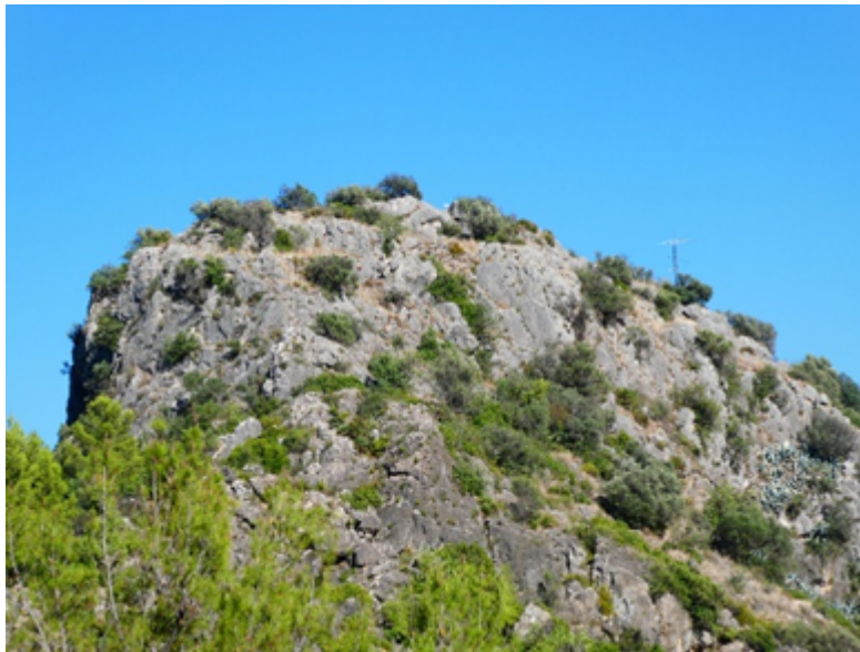
Vista del castell de les Atzavares

observen les restes de murs fets en tàpia de consistència dura. Es tracta d'alineacions rectilínies que delimiten dos recintes de planta rectangular, parcialment excavats a la roca. No es coneix la data exacta de la seua construcció, però s'han trobat restes de ceràmica datades del segle XI. El castell va estar ocupat per Al-Azraq durant la revolta de 1276.