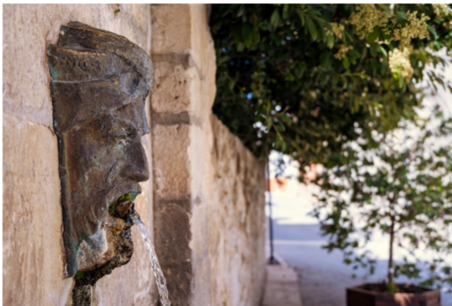
Font de la plaça d'Al-Azraq

Per a tancar el dia podeu passar la nit en Alcalà o bé dirigir-