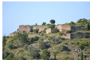
Vista del castell d'Ambra

esperant l'arribada de l'exèrcit cristià. A l'interior de l'albacar hi ha un total de 20 habitatges. El castell no va participar activament en la conquesta, però sí que va tindre importància en les posteriors revoltes mudèjars capitanejades per Al-Azraq. Després d'estar en mans dels sarraïns durant tres anys, a partir de 1276 el castell va començar a perdre la seua importància militar. Va acabar per perdre-la completament quan a partir de 1280 es començà a crear la nova vila de Pego.