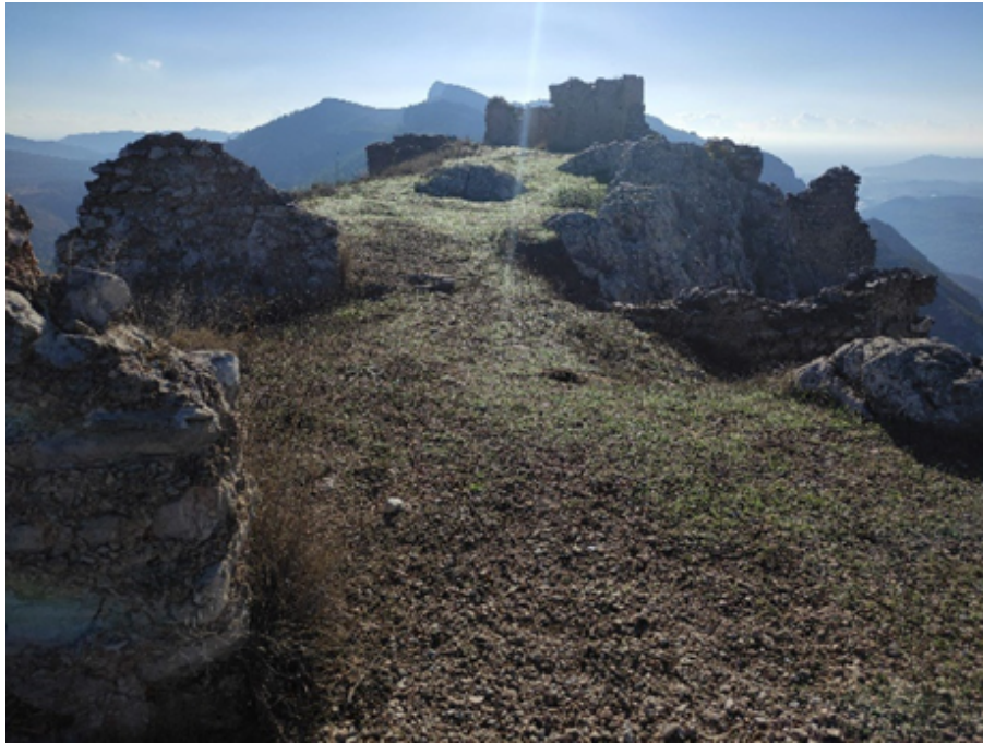
Vista de les restes del castell de la Serrella

En tornar a Castell de Castells, podeu reposar forces, aprofitant que ja ha vingut el fred, recomanem tastar el putxero típic d'allí per entrar en calor. Per a finalitzar la jornada podeu passejar pel nucli històric del poble i visitar el Museu Etnològic d'Art Macroesquemàtic de Petracos , una col·lecció etnogràfica dedicada a conèixer l'arribada del neolític a la península Ibèrica i a comprendre aquelles característiques, reuneix objectes relacionats amb les formes de vida tradicional i el món rural de l'interior de la muntanya alacantina. Cal tindre en compte que el museu sols obri de vesprada els divendres i dissabtes.