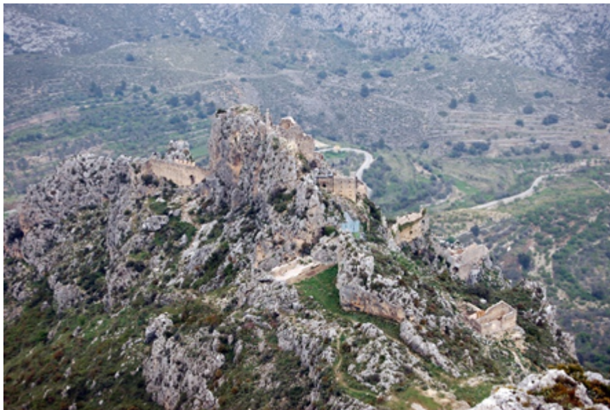
Vista del castell d'Alcalà o de Benissili

La primera etapa d'aquesta ruta la farem per la Vall d'Alcalà , lloc de naixement d'Al-Azraq. Recomanem al matí, que encara no fa tant de sol, fer la ruta al castell, que era la residència habitual del cabdill.