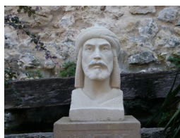
Alcalà de la Jovada

Aquesta empresa va fracassar i Al-Azraq va ser enviat a l'exili, sota la protecció del rei de Castella. La tercera revolta es va produir l'abril de 1276, amb l'assalt a la ciutat d'Alcoi, on va perdre la vida. Va demostrar ser un cabdill astut, misteriós, ambiciós i segur, un personatge ràpidament mitificat pel simbolisme del seu lideratge, fins i tot Pere IV en la seua crònica el descriu com el gran 'capità' al que tots els sarraïns donaren la seua fidelitat. La Marina Alta és una comarca molt rica en patrimoni històric de l'època andalusina.