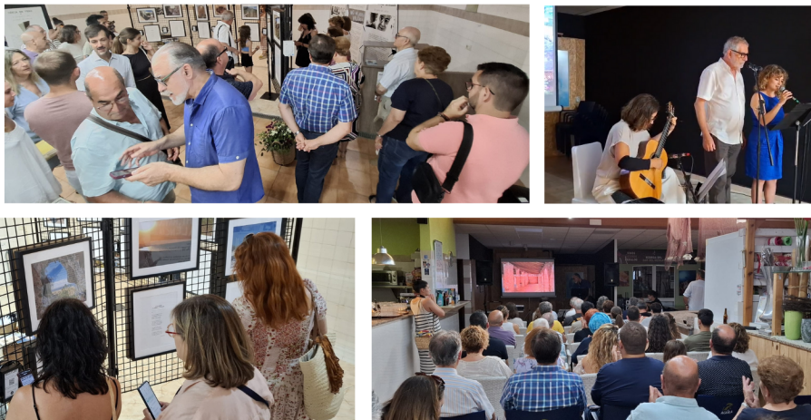
Imatges de la inauguració al Poble Nou de Benitatxell.

Cada una de les exposicions presenta vint poemes del reconegut poeta valencià Vicent Andrés Estellés, acompanyats de fotografies que capturen l'essència de la Marina Alta. Aquesta combinació visual i literària es complementa amb la recitació dels poemes per part d'artistes locals. Les persones interessades a visitar les exposicions podran gaudir de la poesia recitada a través de codis QR que permeten accedir als àudios, així com a través d'uns auriculars disponibles a l'exposició.