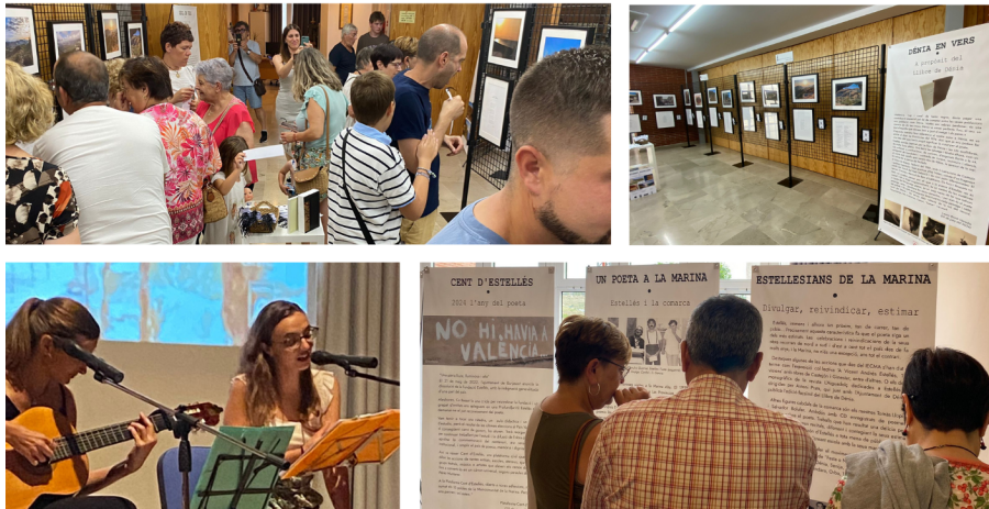
Imatges de la inauguració a Senija.