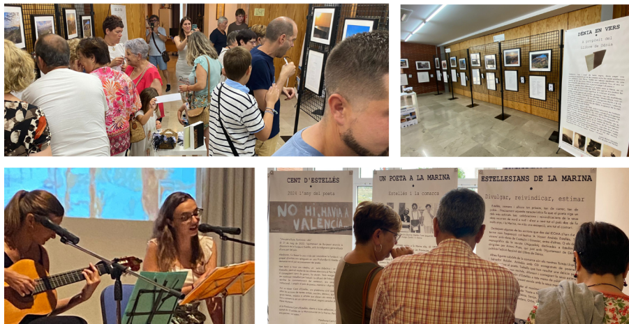
Imatges de la inauguració a Senija.