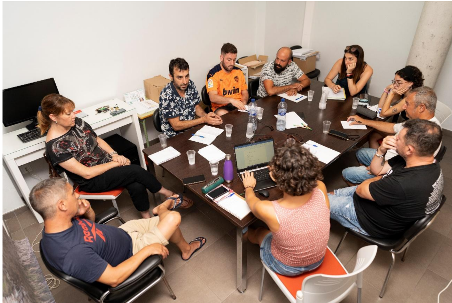
Foto 3. Taula participativa a la Vall de Laguar

En últim lloc, es va portar a terme una visita a Orba per a encetar una taula a l'Espai Girona amb una alta participació. Membres de la corporació municipal, representants de negocis locals, associacions ecologistes, empreses d'oci i aventura i persones a títol individual, es van reunir per a debatre sobre les principals problemàtiques, així com les necessitats existents al municipi d'orba i voltants.