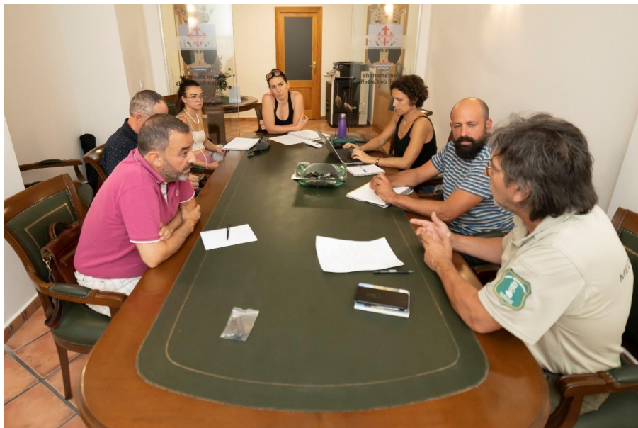
Foto 1. Taula participativa a Castell de castells

El dimarts 18 pel matí va tindre lloc un reconeixement de l'entorn cremat i una posterior taula participativa al municipi de Castell de Castells, amb la presència de membres de la corporació municipal, l'Associació Ecocastells i l'Agent Mediambiental de la zona.