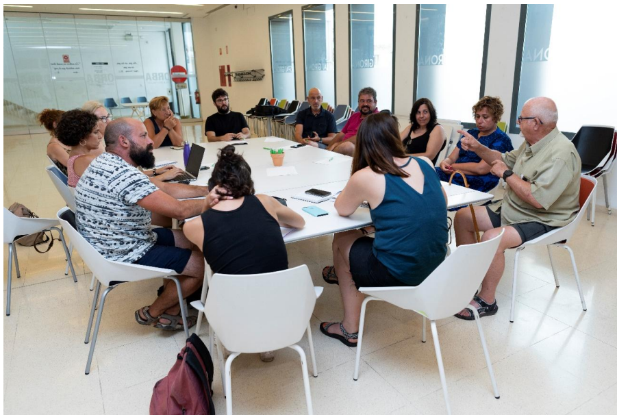
Foto 4. Taula participativa a Orba

En últim lloc, es va portar a terme una visita a Orba per a encetar una taula a l'Espai Girona amb una alta participació. Membres de la corporació municipal, representants de negocis locals, associacions ecologistes, empreses d'oci i aventura i persones a títol individual, es van reunir per a debatre sobre les principals problemàtiques, així com les necessitats existents al municipi d'orba i voltants.